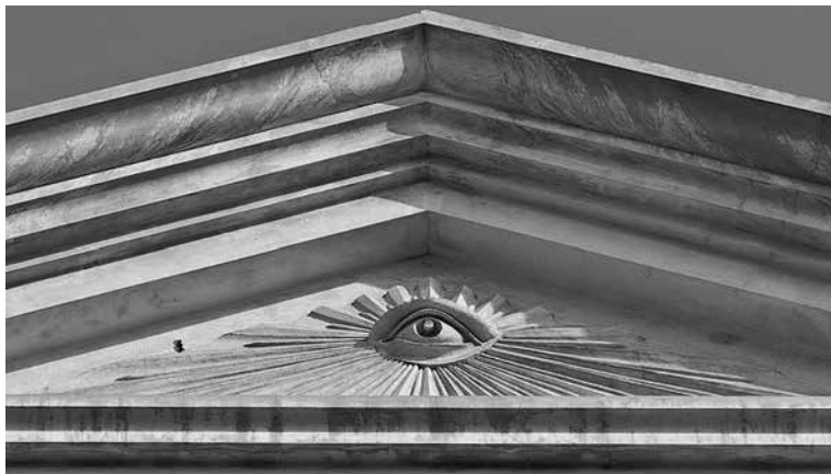
Tempio massonico in Santa Cruz di Tenerife , © Christian Koppchen – Wikimedia Commons FINE

Tristan Mendes-France (un fact-checker ben noto per la sua virulenza contro i teorici della cospirazione): «In questa sequenza, vi è una componente della “complosfera” di estrema destra, molto attaccata ai simboli della religione cattolica, il che è in sé perfettamente legittimo, ma che cerca di vedere dietro questo incidente un piano elaborato da coloro che vogliono distruggere la cristianità, il cattolicesimo e, in ultimo, la civiltà francese». E questa stessa frangia plot-tista aggiunge all’idea di distruzione del 2019 quella della sostituzione con simboli ritenuti massonici, della sostituzione della religione cattolica con un’altra ideologia, essendo la massoneria spesso ritenuta legata al paganesimo o addirittura al satanismo.