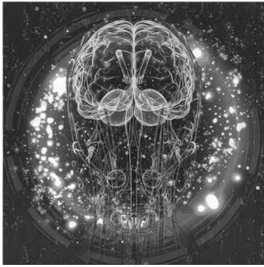
Il cervello umano

È una forza che non conosce i nostri limiti spazio-temporali. Possiamo vedere la luce di stelle estinte da milioni di anni. La luce è fuoco, simile a un defluire potente e senza fine; è Acqua, è forza, un torrente di fotoni. Per avere un'idea dei fotoni, immaginiamo un flusso di luce che si riversa come una cascata, gravità, un'effusione strutturata che non